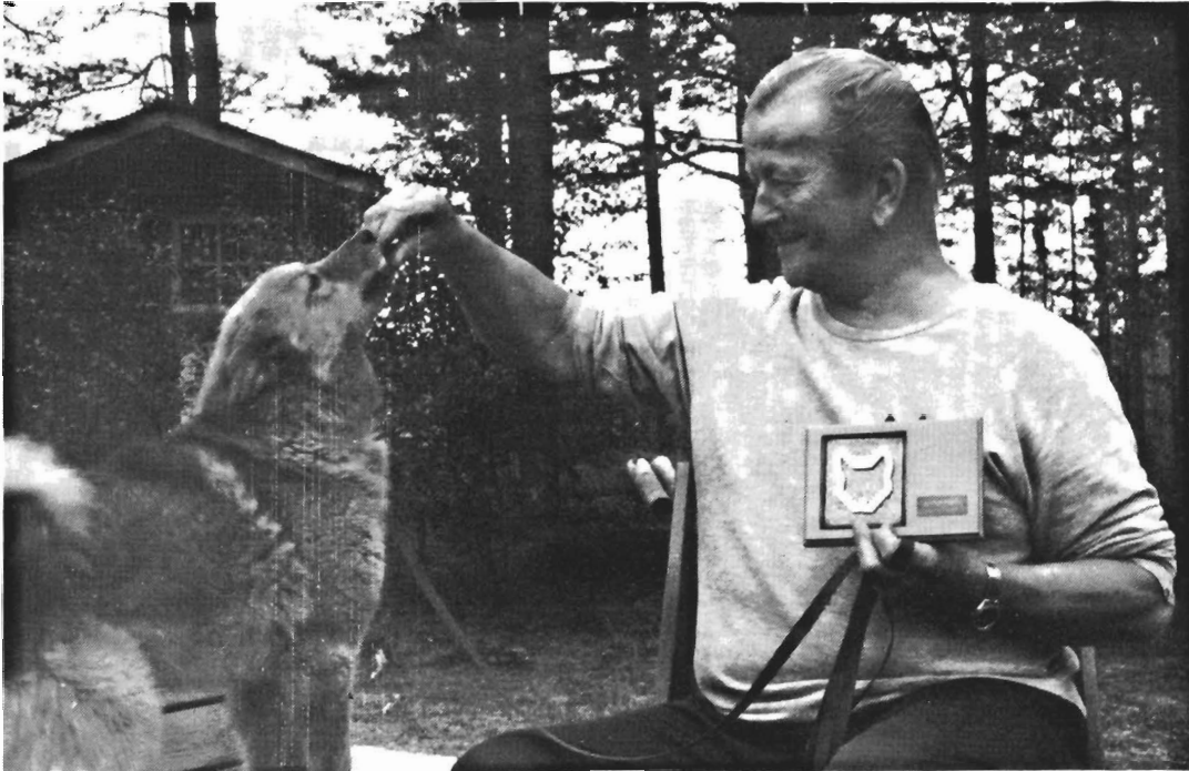
"Arvon Kievari" Muurolassa ottaa pystykorvaisen kulkijan aina ystävällisesti vastaan.

kähdä tuulta eikä tuiskua, ei vesisadetta, eikä pientä pakkastakaan.